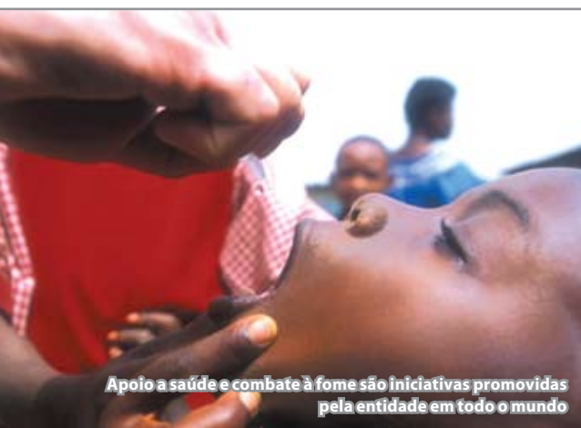
Apoio a saúde e combate à fome são iniciativas promovidas pela entidade em todo o mundo