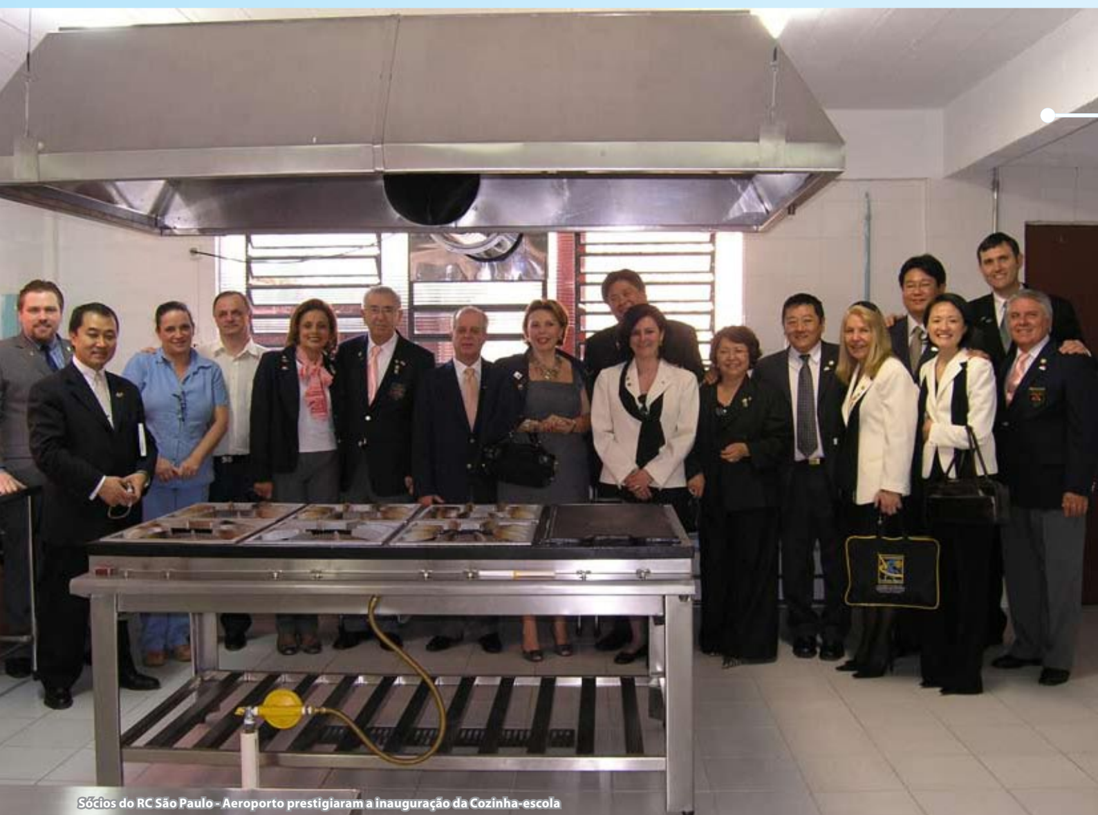
Sócios do RC São Paulo - Aeroporto prestigiaram a inauguração da Cozinha-escola

O Centro Social Brooklin Paulista é uma ONG (Organização Não-Governamental), sem fins lucrativos, que atua desde 1957 junto às comunidades carentes da região do Aeroporto de Congonhas, na zona sul de São Paulo. Inicialmente começou com um grupo de voluntários que entregavam alimentos às famílias carentes, e com o tempo foram ampliados os objetivos e, hoje, a entidade atende cerca de 750 crianças e adolescentes, enfocando a formação sócio-cultural e profissionalização dos jovens, com aulas de informática, música, oficina de corte e costura, extensão cultural, culinária industrial, teatro e inglês.