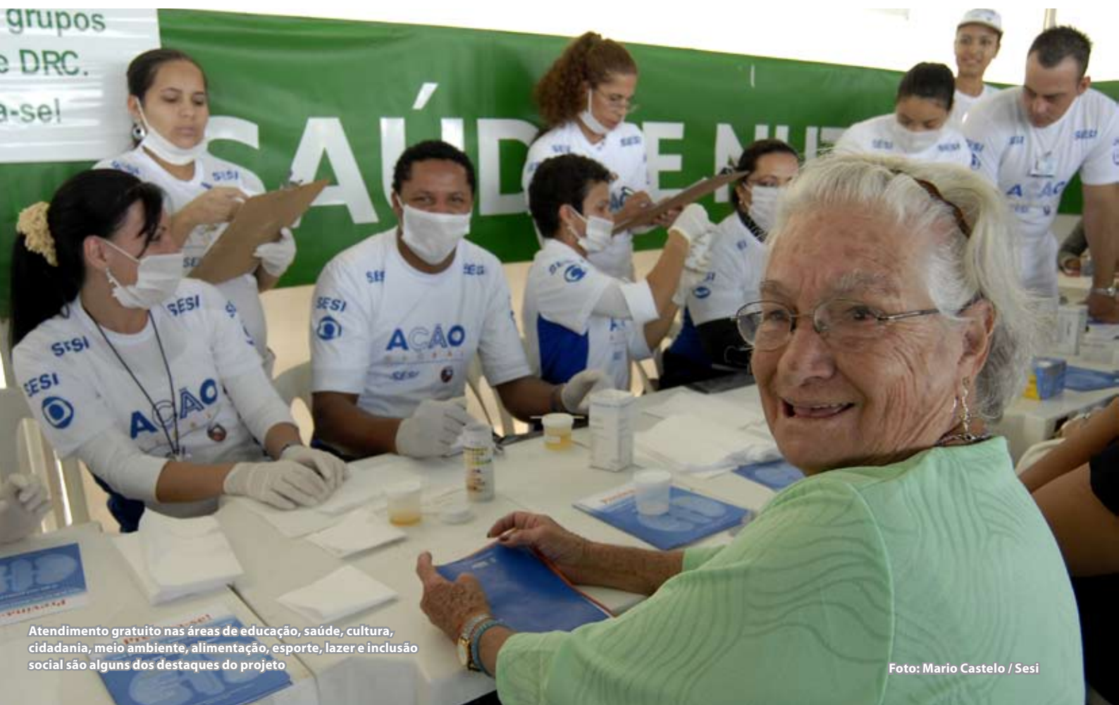
Atendimento gratuito nas áreas de educação, saúde, cultura, cidadania, meio ambiente, alimentação, esporte, lazer e inclusão social são alguns dos destaques do projeto

O Distrito 4420 contribuiu para a realização da 15ª edição do "Ação Global Nacional", que aconteceu dia 17 de