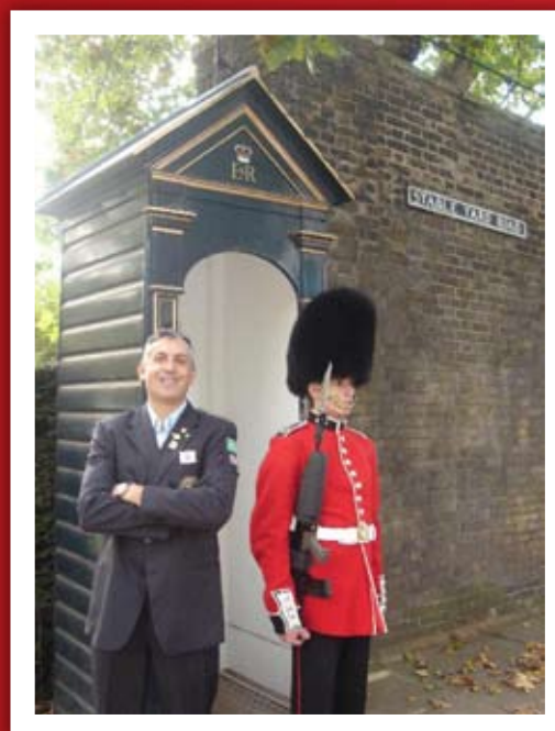
Guarda Real Entrada para a residência oficial do Príncipe Charles.