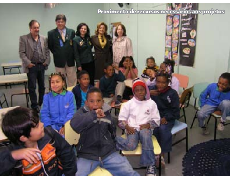
Provimento de recursos necessários aos projetos