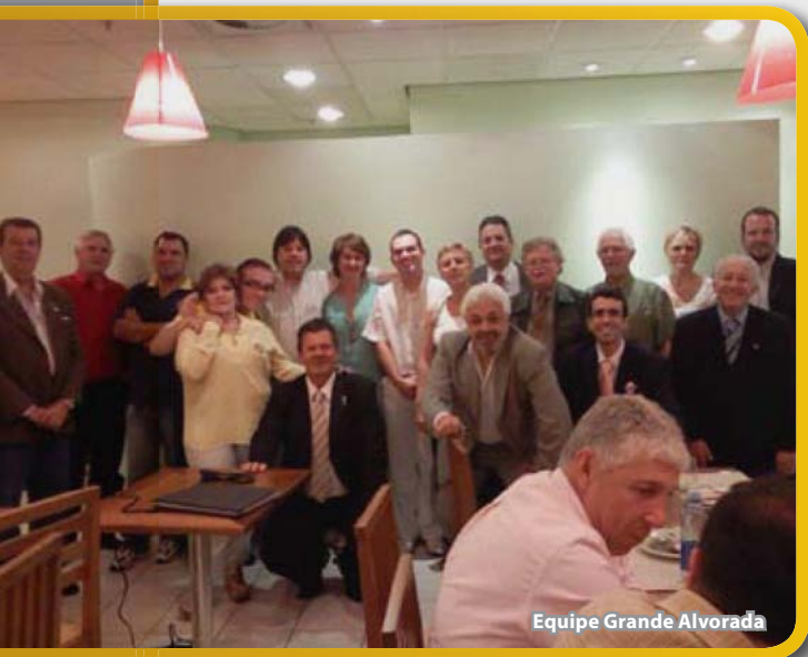
Equipe Grande Alvorada