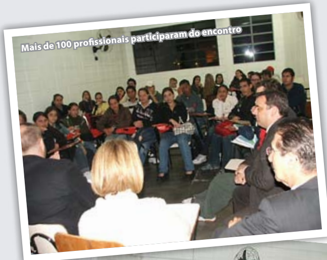
Mais de 100 profissionais participaram do encontro