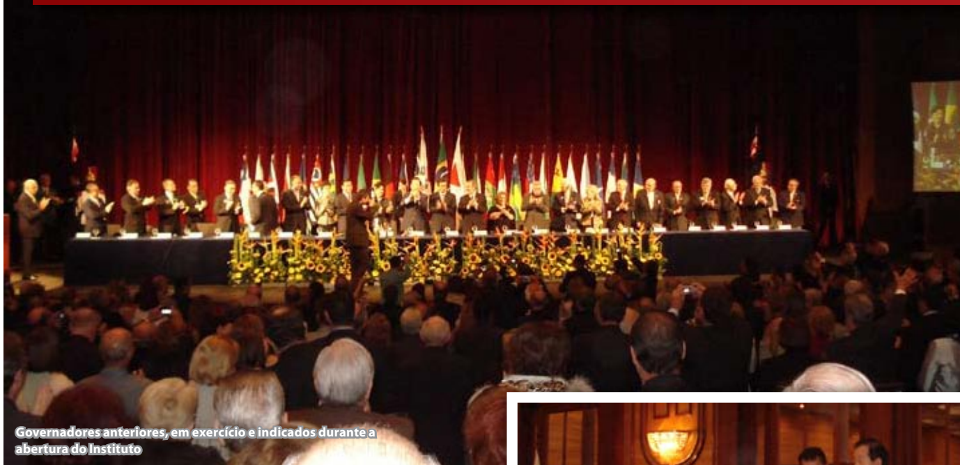
Governadores anteriores, em exercício e indicados durante a abertura do Instituto

A capital de Minas Gerais, Belo Horizonte foi à sede, entre os dias 18 e 20 de setembro, do XXXI Instituto Rotário do Brasil. Bem representado, nosso Distrito marcou presença neste importante encontro, realizado anualmente, que busca reunir governadores anteriores em exercício e também indicados da entidade Rotary. Organizado por determinação do Conselho Diretor do Rotary International (RI), o objetivo do Instituto é avaliar a atuação do Rotary, seus programas atuais e perspectivas para o futuro, para no final das atividades identificar mudanças e adaptações necessárias ao seu estatuto e regimento.