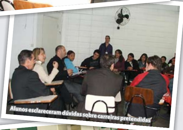
Alunos esclareceram dúvidas sobre carreiras pretendidas