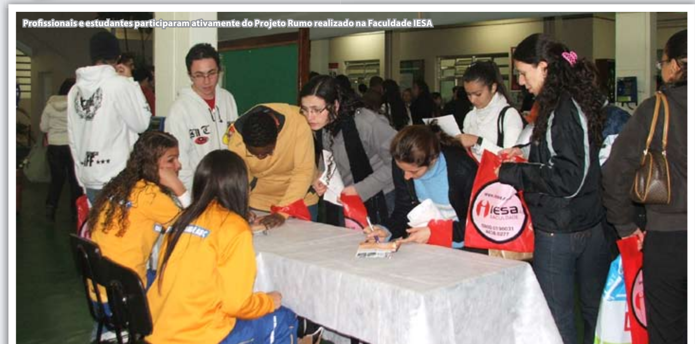
Profissionais e estudantes participaram ativamente do Projeto Rumo realizado na Faculdade IESA

disciplinas, sobram vagas no mercado. Ao final do Fórum, o público também participou de um sorteio de brindes como MP4, pendrive e vários DVDs musicais.