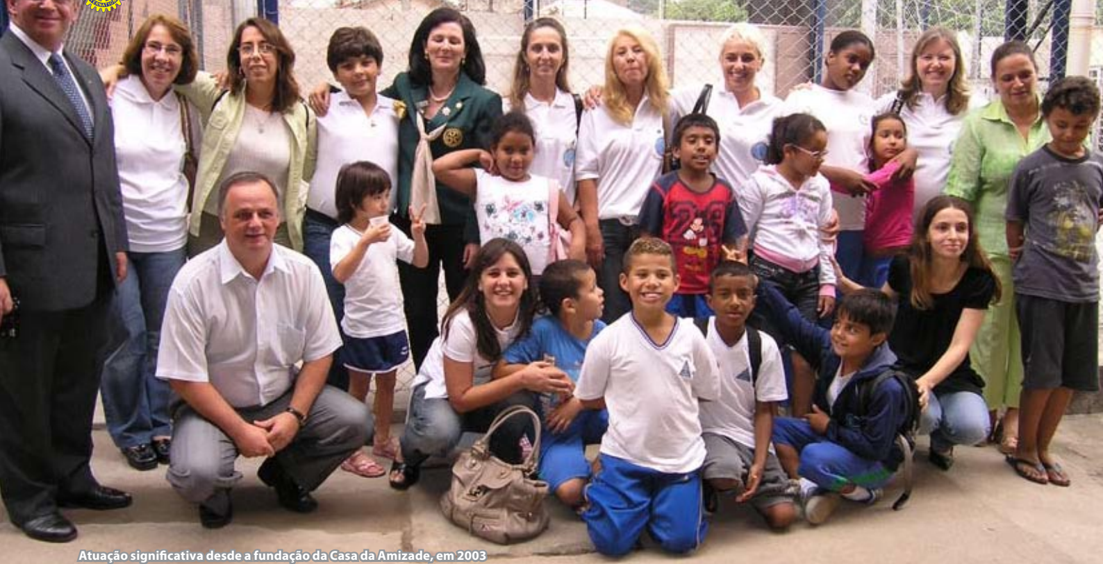
Atuação significativa desde a fundação da Casa da Amizade, em 2003