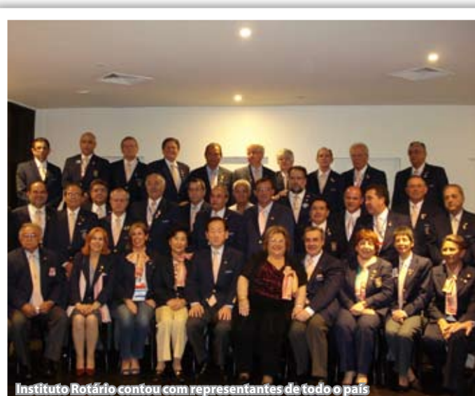
Instituto Rotário contou com representantes de todo o país