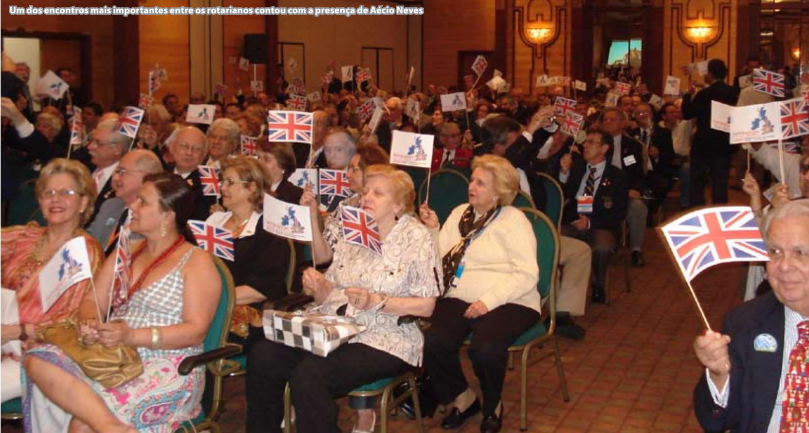
Um dos encontros mais importantes entre os rotarianos contou com a presença de Aécio Neves