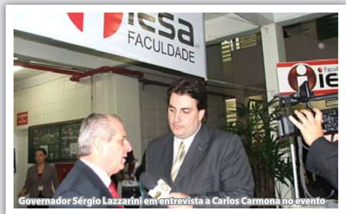
Governador Sérgio Lazzarini em entrevista a Carlos Carmona no evento