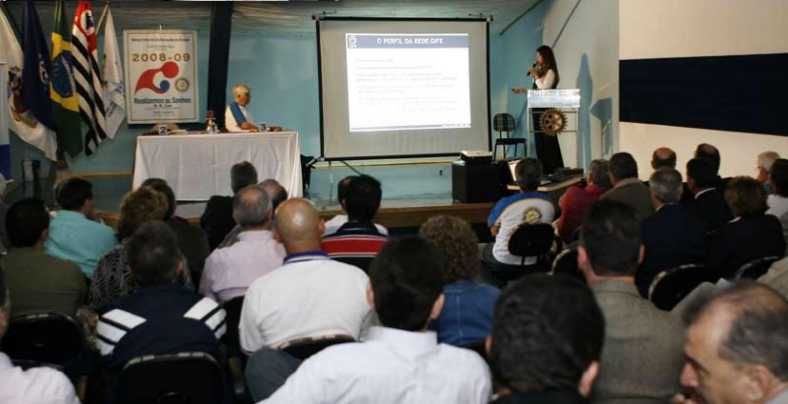
Rotarianos receberam informação sobre como arrecadar fundos de empresas