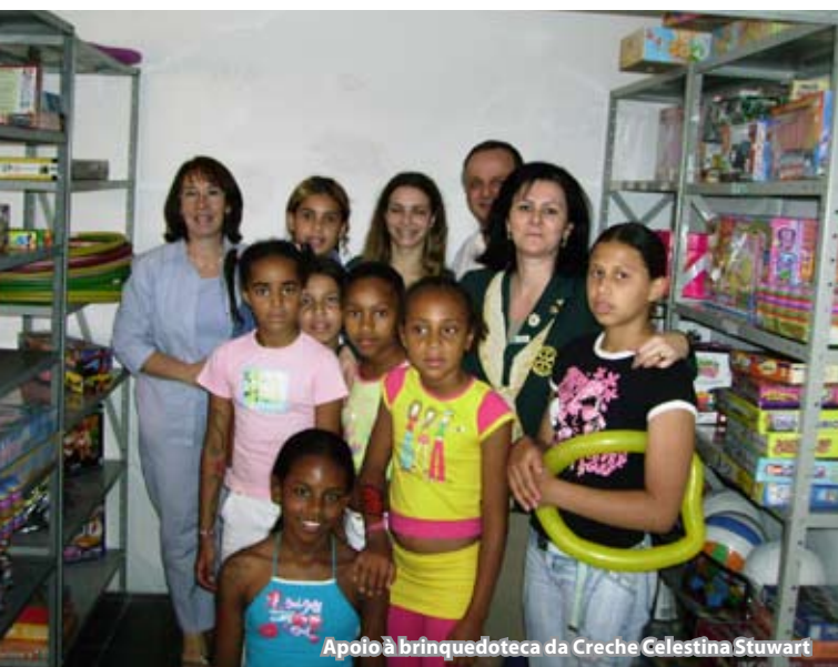
Apoio à brinquedoteca da Creche Celestina Stuart