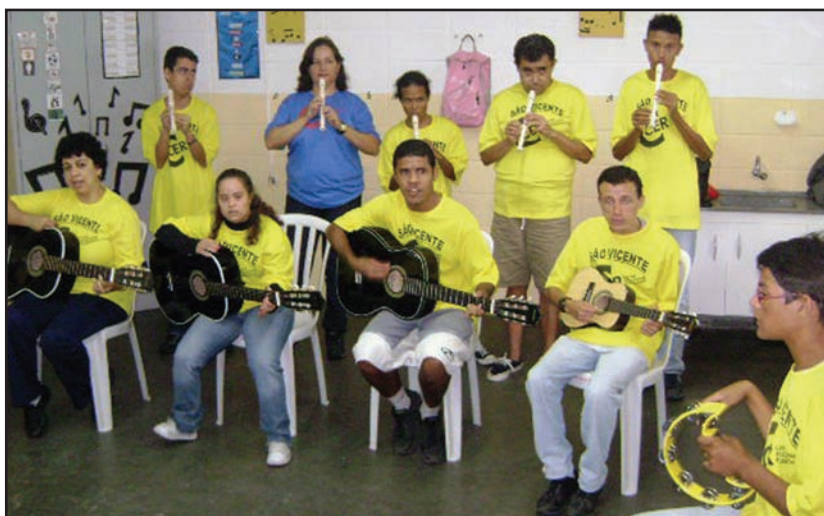
Além dos clubes casal governador visita entidades

DQS: padrinhos concorrem à cabine da Conferência