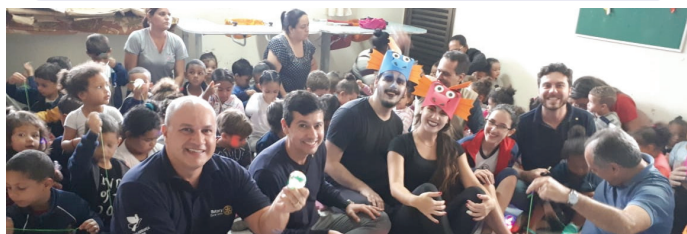
Instituto São José - Unidade Caminho São José