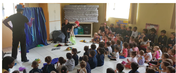
Instituto São José - Unidade Paróquia