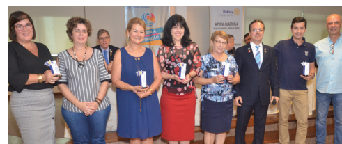
Momento da entrega dos troféus do Melhor Companheiro