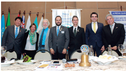
Mesa da presidência

Cerca de 100 pessoas estiveram presentes entre Companheiros, convidados, cônjuges, intercambistas, Interactianos e Rotaractianos.