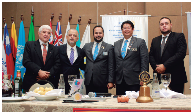
Mesa da presidência

Cerca de 120 pessoas estiveram presentes entre companheiros, autoridades, convidados, cônjuges, intercambistas e Rotaractianos.