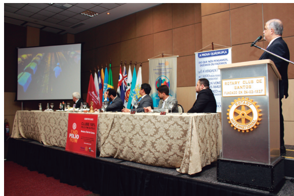
Momento da palestra