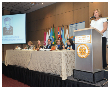
Momento da apresentação do Prêmio Mérito Feminino “Terezinha Maria Calçada Bastos”